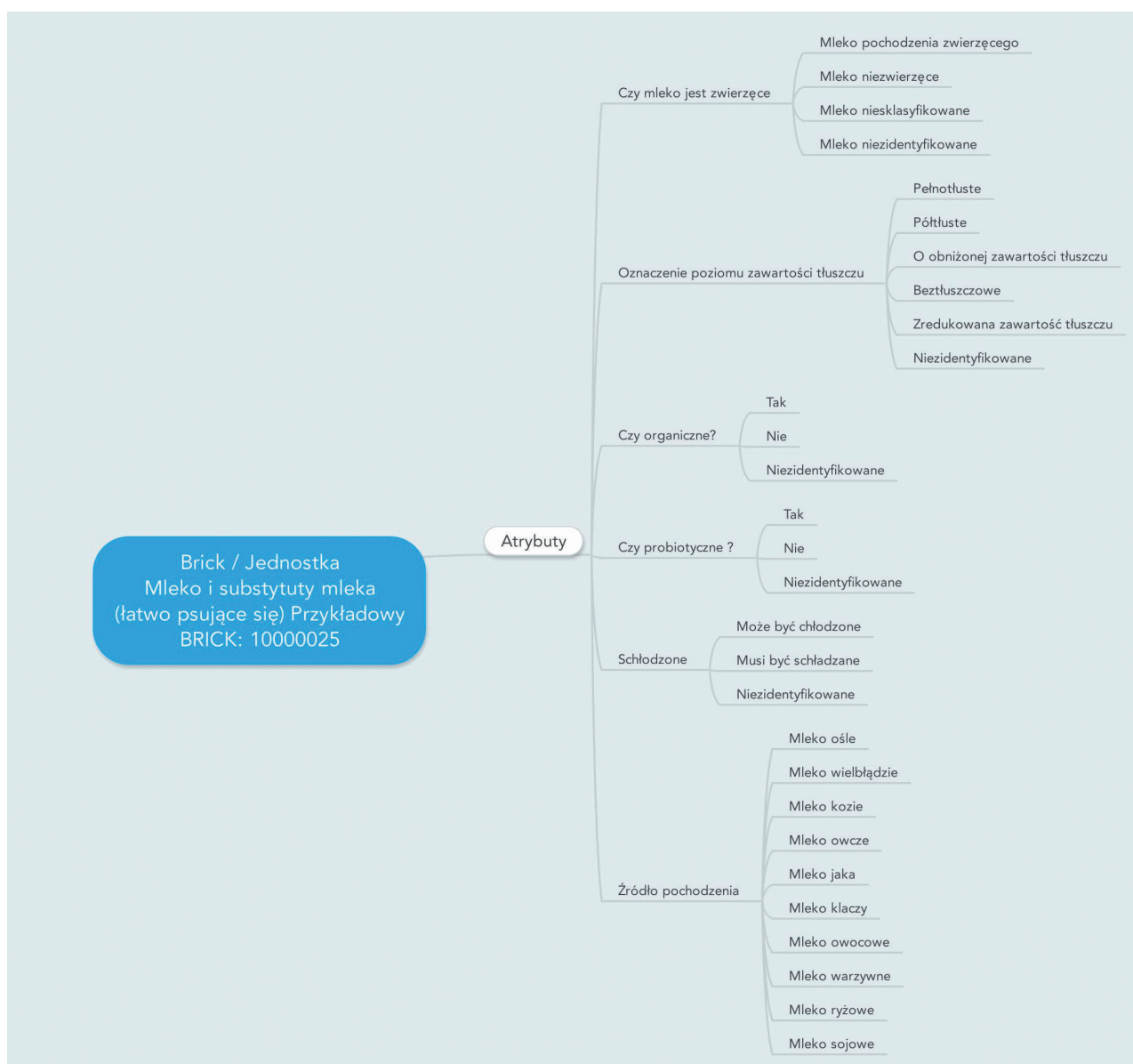
Rys. 2. Przykład struktury schematu GPC.

Zapraszamy do pobrania i przeanalizowania dokumentu.