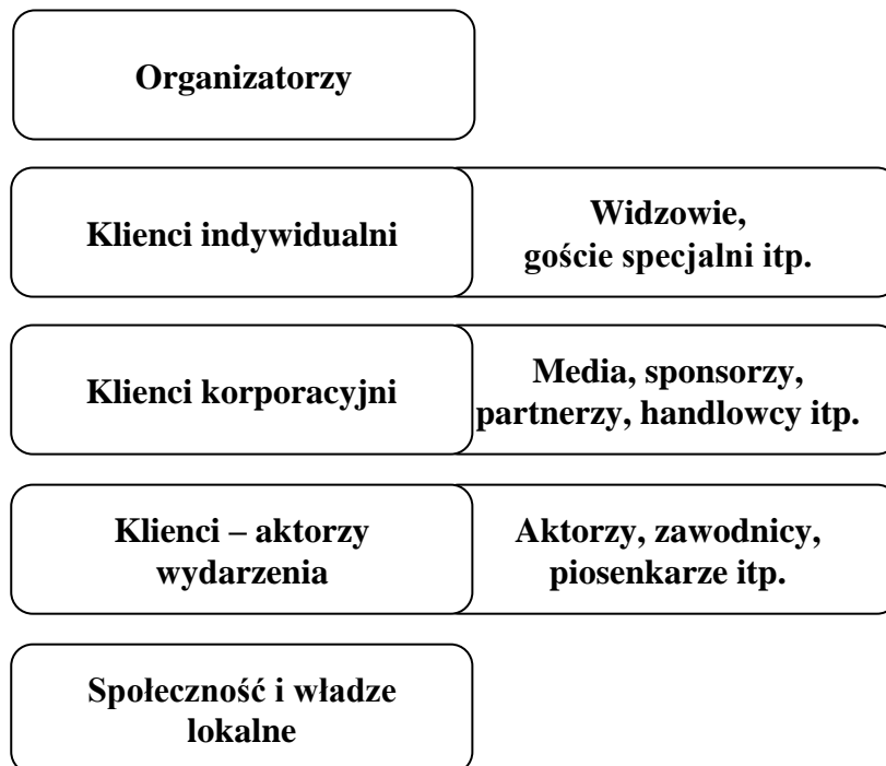
Rysunek 2. Typologia podmiotów występujących w imprezach masowych

danej imprezy masowej, zarówno na etapie projektowania, organizowania jak i w trakcie jej trwania.