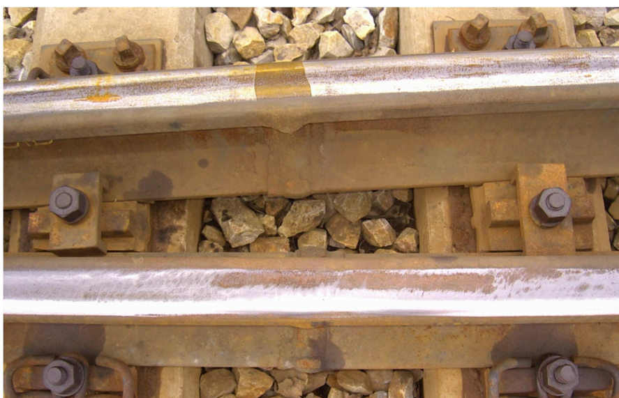
Fot.5. Połączenie spawane – zbyt głębokie szlifowanie szyny