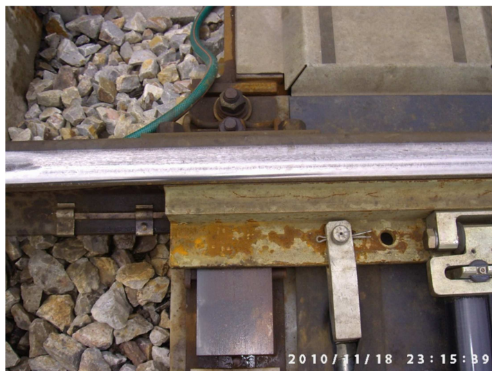
Fot.1. Widok opornicy prostej i iglicy łukowej (przyleganie iglicy do opornicy)

W praktyce diagnostyka obrazowa powinna być stosowana od momentu ułożenia nowego rozjazdu, nawet wtedy, gdy nie wykryto żadnych wad. Należy wówczas wykonać kilka zdjęć ogólnych, np. iglicy i opornicy, krzyżownicy, dzioba krzyżownicy, urządzenia przeciwpełznego oraz widok rozjazdu w stosunku do przyległych torów i innych rozjazdów.