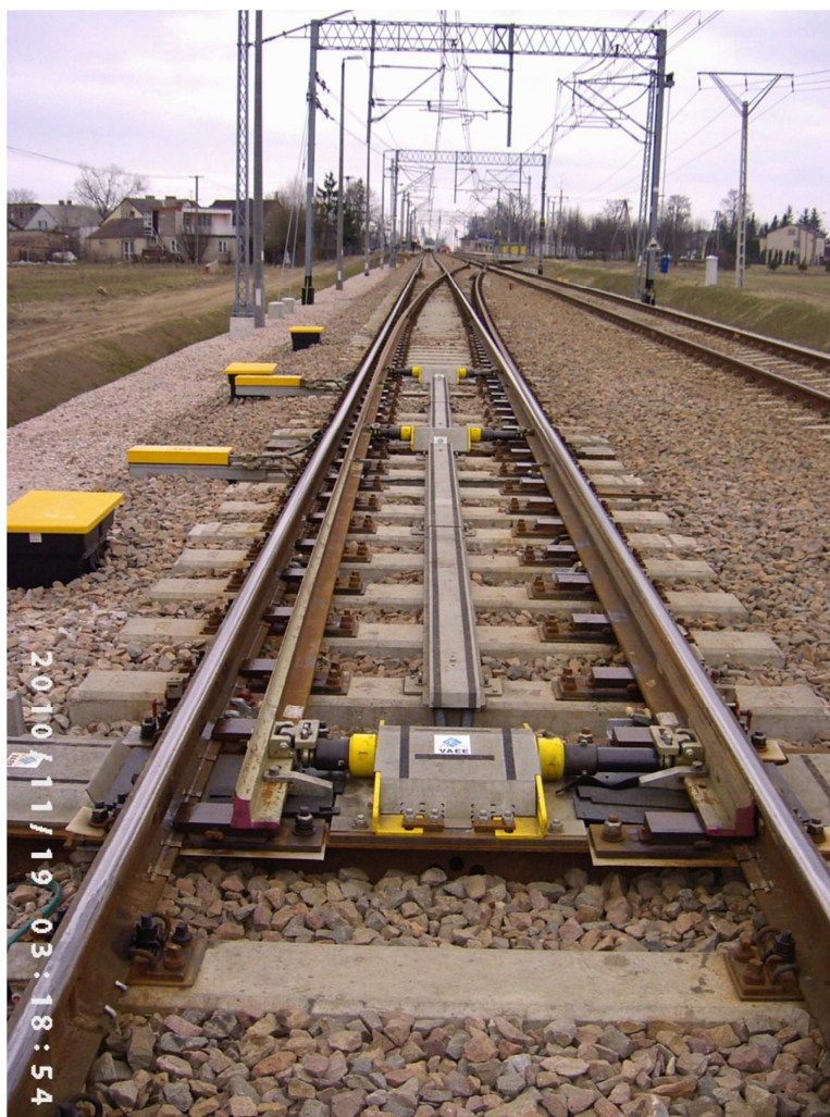
Fot.2. Widok ogólny rozjazdu Nr 1 na stacji G (Rz 60E1 1200 1:18,5)

Na fotografiach Nr 1 i 2 przedstawiono dwa przykładowe ujęcia na etapie oddania rozjazdu kolejowego do eksploatacji. Zdjęcie Nr 2 obrazuje ogólny widok rozjazdu Nr 1 na stacji G, który z dalej widocznym rozjazdem Nr 2 tworzy połączenie dwóch torów równoległych. Natomiast na fotografii Nr 1 pokazano przyleganie iglicy łukowej do opornicy prostej w rozjeździe Nr 1.