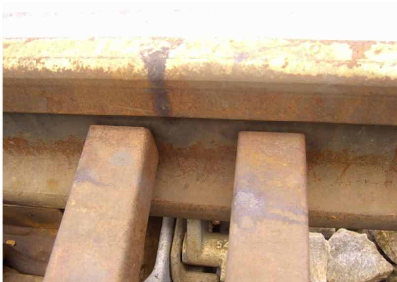
Fot.7. Brak przyleganie iglicy do opórek