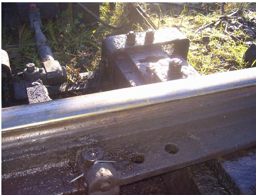
Fot.3. Iglica łukowa i opornica prosta – kod wady 1241224

Jako przykład zastosowania typologii wad w diagnostyce obrazowej posłuży fotografia Nr 3. Na zdjęciu widoczna jest iglica łukowa, przylegająca dobrze do opornicy prostej. W iglicy łukowej (prawej) stwierdzono wyszczerbienie w odległości 30 cm od początku iglicy na długości 16 cm oraz zużycie boczne iglicy w tym miejscu równe jest 3 mm. Jednak w dalszej części zużycie iglicy wynosi 8 mm, co kwalifikuje ją do wymiany.