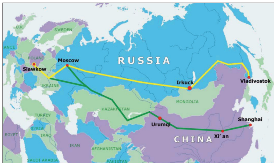
Rys. 2. Położenie kolei transkontynentalnych.

Należy zaznaczyć, iż pozycja MCL wzrasta także dzięki uruchomionym relacjom kolejowym: