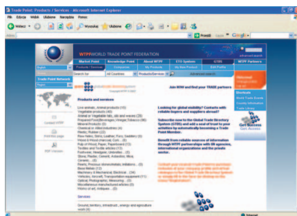
Rys. 2. Katalog GTDS w międzynarodowym systemie TPP

System międzynarodowy umożliwia także dostęp do Globalnego Katalogu Handlowego (The Global Trade Directory System), który jest ogólnosiwiatową bazą firm, która pozwala na zarejestrowanie profilu firmy zdefiniowanego na podstawie ustandaryzowanego zakresu danych. Obejmuje on dane teleadresowe firmy, listę oferowanych produktów i usług z możliwością dołączenia zdjęć oraz innych szczegółowych informacji o cenach, opakowaniu, transporcie.