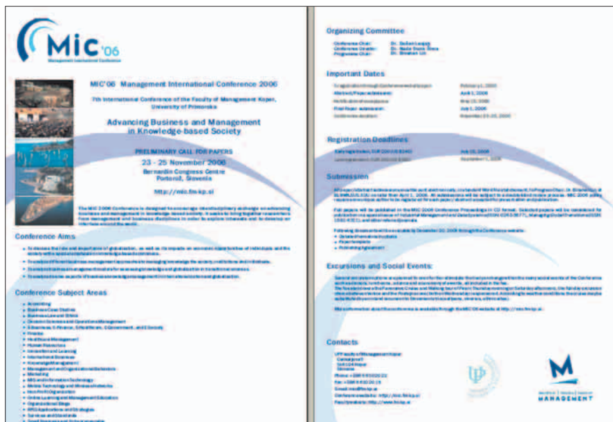
Rys. 5. CFP w postaci załącznika PDF do listu elektronicznego.

torów wystąpień. Warto w tym momencie wspomnieć – często praktykowane na polskich konferencjach naukowych – zachowania typu: „profesora nie wypada o to pytać”, albo „nie zgadzam się z poglądem autora, ale nie będę go stresował uwagami”. Tego typu zachowania nie zdarzają się na dużych konferencjach międzynarodowych. Jest to spowodowane głównie faktem, iż ich uczestnicy są tam właśnie po to, aby ich teksty wywołały merytoryczną dyskusję nad poruszaną problematyką, spowodowały jak najwięcej uwag