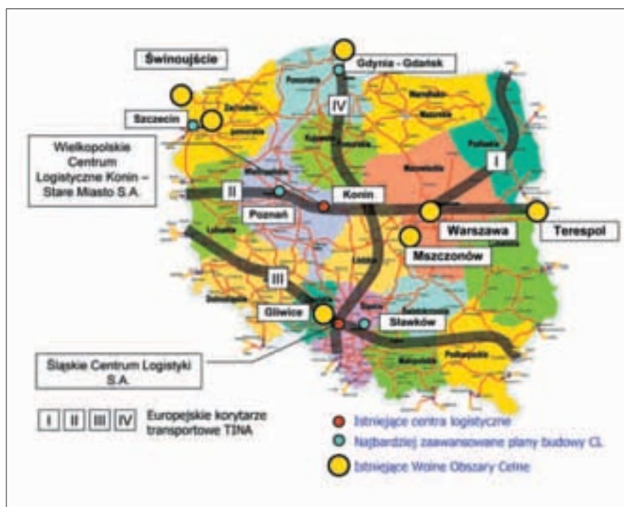
Rys. 2. Lokalizacja Wolnych Obszarów Celnych i istniejących lub planowanych centrów logistycznych.

zmiany w przepływie strumieni towarów przez Polskę – zatrzymać czasowo w naszym kraju dotychczasowy, tranzytowy, dwukierunkowy strumień towarów i wygenerować duży potencjał zadań logistycznych związanych z tym przystankiem.