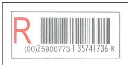
Rys. 2. Etykieta R przedstawiająca identyfikację przesyłki poleconej, stosowana do końca grudnia 2011 roku.

Poczta Polska to przedsiębiorstwo z ponad 450-letnią tradycją, będąca jedną z najstarszych instytucji w Polsce. Posiada około 8400 placówek pocztowych i jest jednym z największych operatorów pocztowych na rynku, nie tylko w Polsce, ale także w Europie Środkowej. Przedsiębiorstwo jest także jedną z największych organizacji w Polsce pod względem liczby zatrudnionych osób