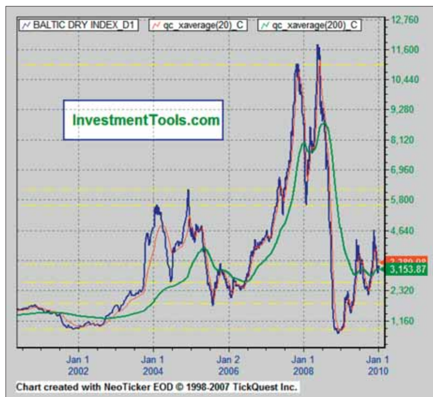
Rys. 1. Baltic Dry Index, zmiany w okresie styczeń 2002 – styczeń 2010. Źródło: http://investmenttools.com/futures/bdi_baltic_dry_index.htm#bdi [wgląd 10.01.2010].

Mimo spadku popytu na przeładunki masowe i drobnicę jeszcze w 2008 roku i na początku 2009 roku, rosła podaż statków i powierzchni ładunkowej. Na początku ub. r. flota światowa dysponowała 1,19 mld dwt i była większa o 6,7%, niż w styczniu 2008 roku. Mimo spadku globalnej produkcji w stocznich prowadzono intensywną produkcję nowych jednostek realizując rozbudowane portfele zamówień na statki zakontraktowane w latach 2007 – 2008. Dostawy jednostek przekraczały nawet dwukrotnie ilość jed-